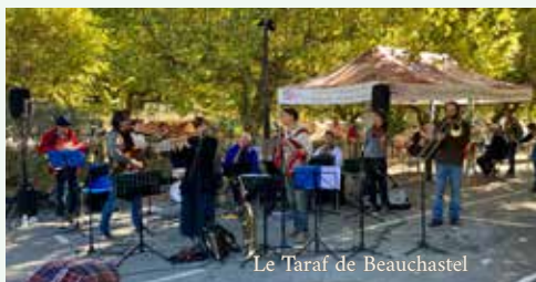
Le Taraf de Beauchastel