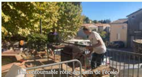
L'incontournable rôtie des amis de l'école