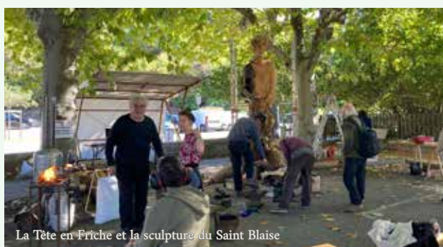
La Tête en Friche et la sculpture du Saint Blaise