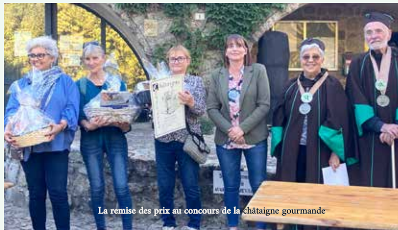
La remise des prix au concours de la châtaigne gourmande