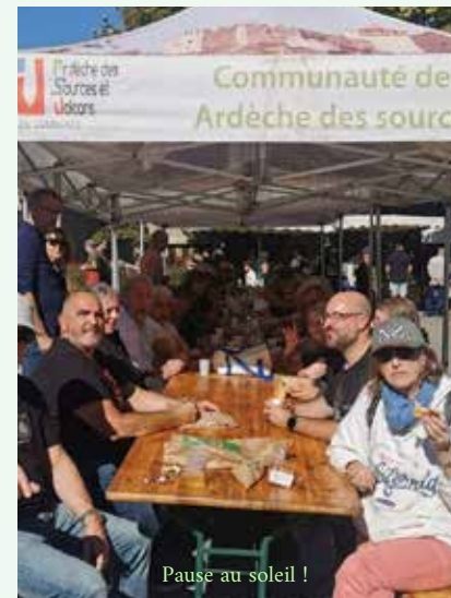
Pause au soleil !