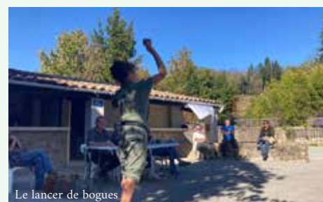
Le lancer de bogues