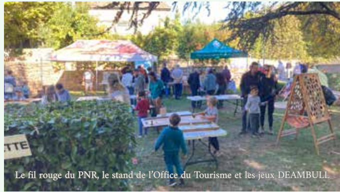
Le fil rouge du PNR, le stand de l'Office du Tourisme et les jeux DEAMBULL