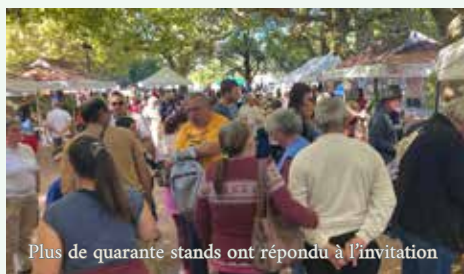
Plus de quarante stands ont répondu à l'invitation

Retour en images sur cette édition ensoleillée et festive