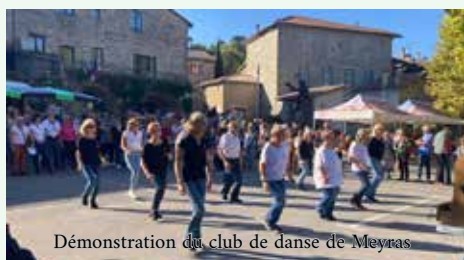
Démonstration du club de danse de Meyras