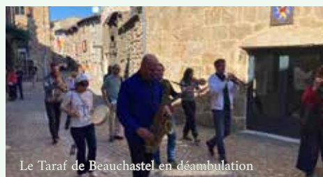
Le Taraf de Beauchastel en déambulation