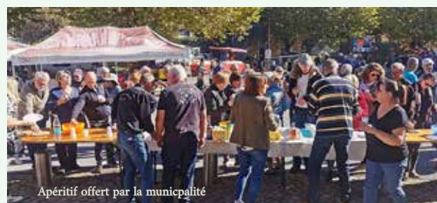
Apéritif offert par la municipalité