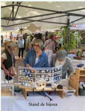
Stand de bijoux