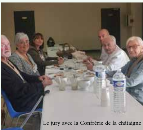
Le jury avec la Confrérie de la châtaigne