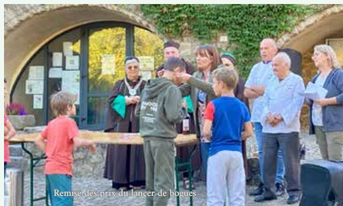
Remise des prix du lancer de bogues