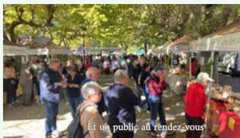
Et un public au rendez-vous