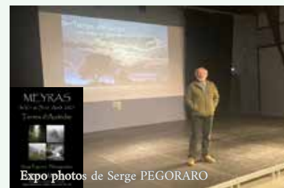
Expo photos de Serge PEGORARO